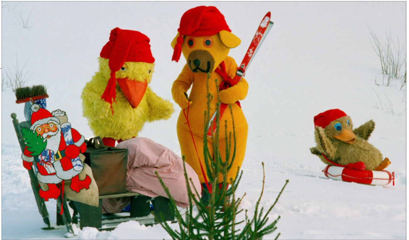
Børnefamilier kan tage hul på TV 2's "Alletiders Jul" kl. 16.30, zappe videre til DR's fire juleudsendelser på Ramasjang og Ultra og runde af med hovedkanalens kronjuvel, "Theo og Den Magiske Talisman", samt efterfølgende "Tvillingerne og Julemanden" på TV 2 kl. 20.35. Hullerne i programmet kan man fylde ud med f.eks. "Bamses Julerejse" på DRTV.

Torsdagens køb i New York er langt fra første gang, at samlere betaler store summer for artefakter fra Månen. Bl.a. blev en lille taske, som den amerikanske astronaut Neil Armstrong havde med sig under månelandingen i 1969, sidste år solgt for 1,8 mio. dollars – i dag svarende til ca. 11,8 mio. kr. Den blev brugt til at bære materiale fra Månen og indeholdt stadig spor efter månestøv. Reuters